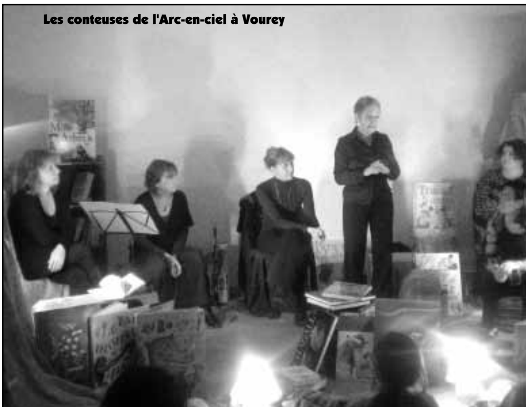
Les conteuses de l'Arc-en-ciel à Vourey

1980 à nos jours, grâce à de nombreuses photos anciennes et récentes, une grille géante de mots croisés, ainsi qu'une exposition de travaux d'enfants sur le thème des Fables de La Fontaine.