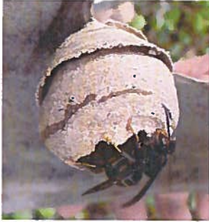
Basile Naillon, 2012

Au printemps, la femelle fondatrice construit seule un nid primaire dans lequel elle élève la première génération d'ouvrières. Ce nid de petite taille est souvent construit à faible hauteur.