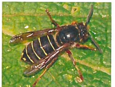
Guêpe des buissons Dolichovespula media (Jeremy Early, 2010)