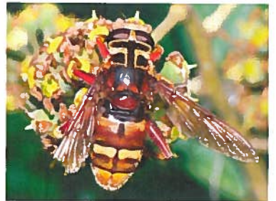
Milesie faux-frelon Milesia crabroniformis (Pierre Falatico, 2009)