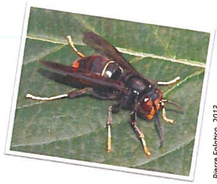
Pierre Falatico, 2013

Le frelon asiatique est très souvent confondu avec le frelon européen. Voici comment les différencier :