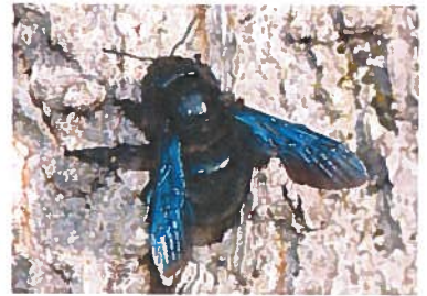
Abeille charpentière Xylocopa violacea (Pierre Falatico, 2010)