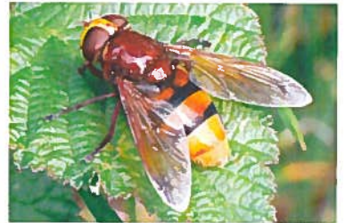
Volucelle zonée Volucella zonaria (Pierre Falatico, 2005)