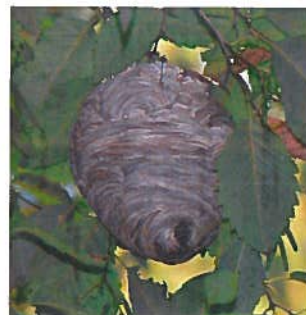
The High Fin Sperm Whale, 2011

De couleur grise, son ouverture de petite taille est située à la base du nid et légèrement excentrée