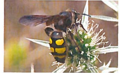
Scolie Colpa sexmaculata (Pierre Falatico, 2010)